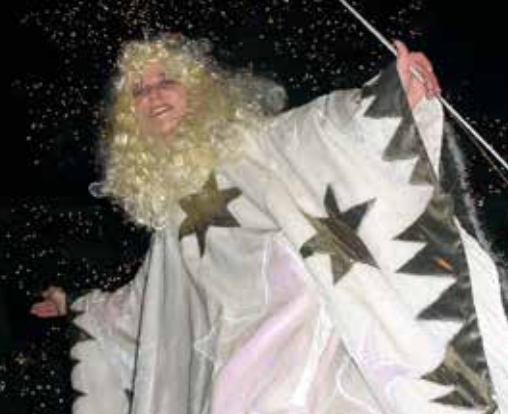
Weihnachtsengel auf Stelzen