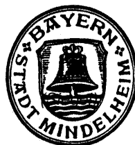
Dr. Stephan Winter Erster Bürgermeister

(zum Anschlag an der Amtstafel in der Passage der Hospitalstiftung und im Schaukasten im Rathaus der Stadt Mindelheim am 17.11.2023)