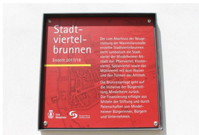
Eine Info-Tafel an der Wand der Jesuitenkirche erläutert in kurzen Worten den Brunnen, mit der symbolischen Darstellung der früheren Stadtviertel der Mindelheimer Altstadt.

- Zur Einbringung des erforderlichen privaten Eigenkapitals haben wir eine Zahlung an den Stadtentwicklungsfonds der Stadt Mindelheim geleistet. Darin werden Aufgaben und Projekte für die nachhaltige Stadtentwicklung wahrgenommen in öffentlich-privater Partnerschaft.